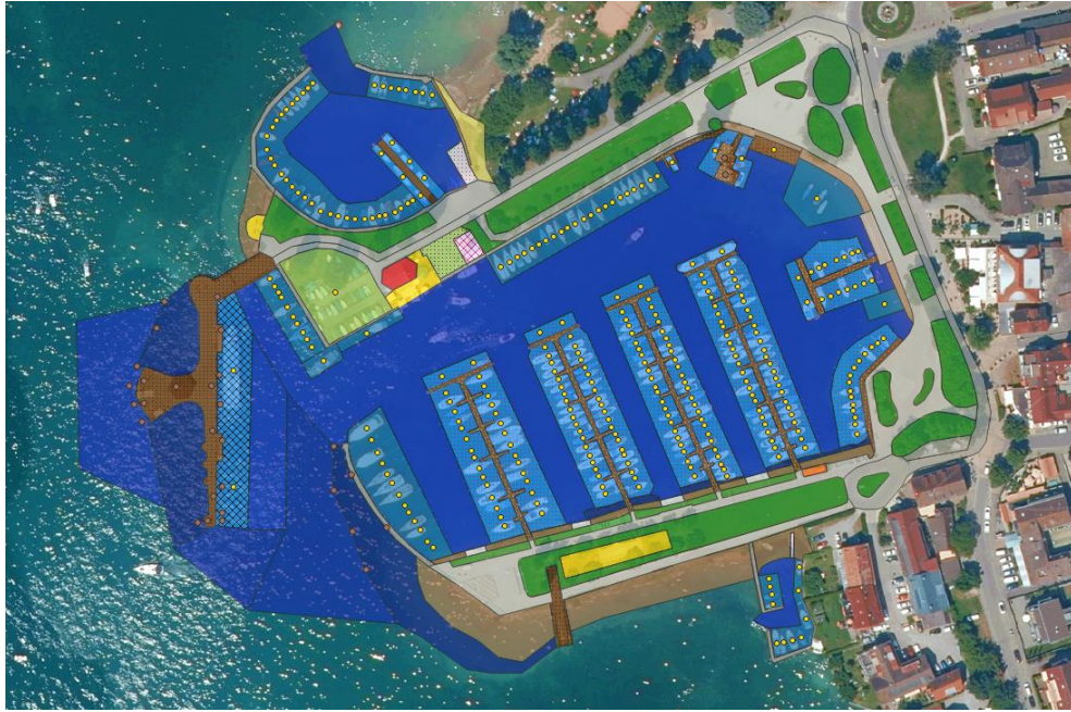
Abbildung 4: Erfassung der einzelnen Liegeplätze (gelbe Punkte) und verorteten Ausstattungselemente (braune Punkte). Bei den Liegeplätzen handelt es sich um Punkt-Objekte, die als angenommener, etwas unscharfer Zentroid der Liegeplatzfläche für ein einzelnes Boot oder eine Bootsguppe angesehen werden können (vgl. Abschnitt 3.6.1). Zwar wurden Liegeplatzflächen bereits mit dem Strukturelemente-Layer ausgewiesen, der ergänzende Punktlayer erlaubt jedoch eine Individualisierung einzelner Liegeplätze und einfachere Möglichkeiten der Verschneidung mit anderen Geodaten.