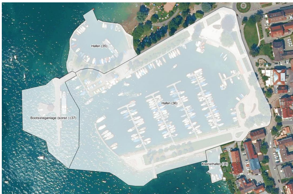
Abbildung 3: Der Objekt-Layer Bootsstationierungsanlagen wird nicht gesondert digitalisiert. Er ergibt sich rechnerisch durch „Dissolve“ des Strukturelemente-Layers über die zugehörige, in MS Access hinterlegte BoStA-ID.