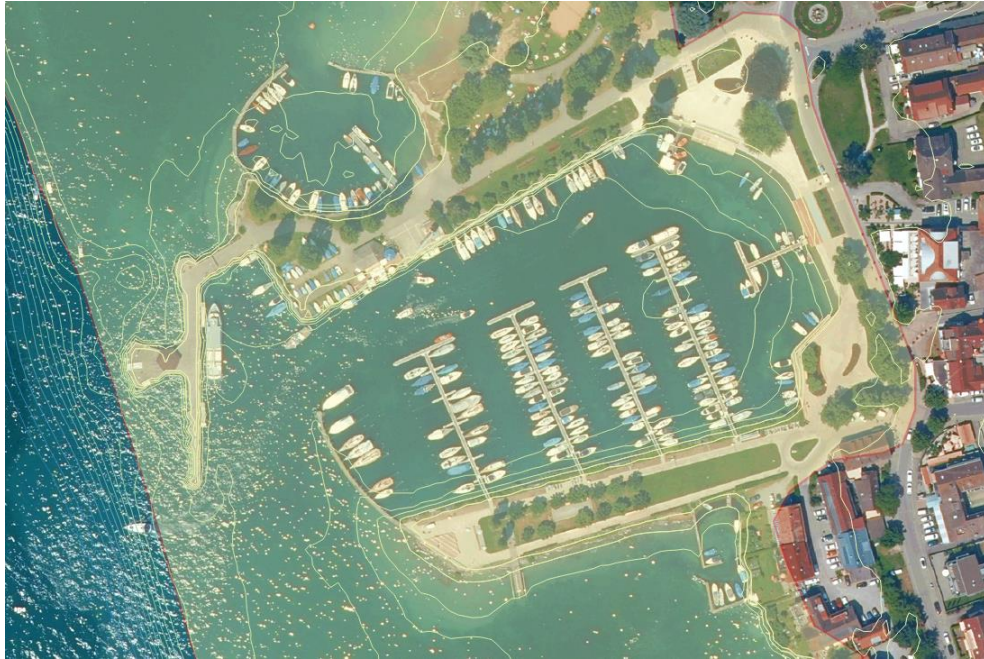
Abbildung 6: Ausweisung der Potentialfläche anhand relevanter Höhen- bzw. Tiefenlinien und (historischer) Gebäude.