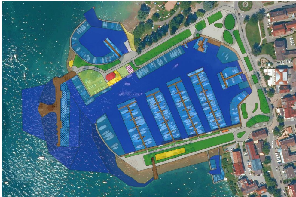
Abbildung 2: Flächige Digitalisierung der Strukturelemente. Durch die Verbindung zur Datenbank können die einzelnen Objekte z.B. entsprechend ihres Objekttyps dargestellt werden.