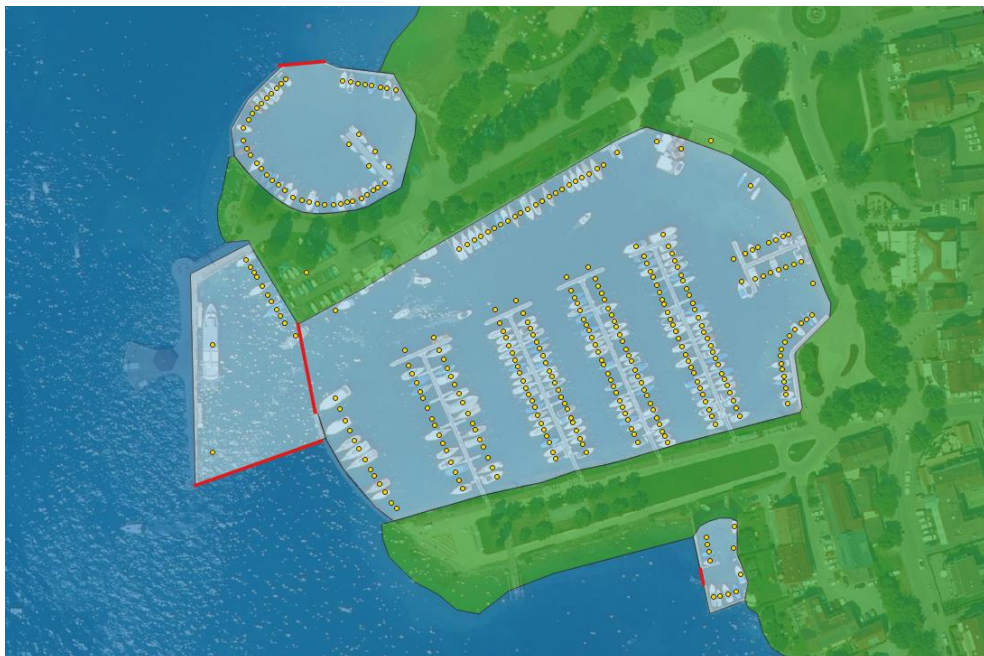
Abbildung 5: Wasseraustausch von BoStA-Flächen: grün – Landfläche, hellblau – Wasseraustausch deutlich eingeschränkt dunkelblau – Wasseraustausch wenig eingeschränkt, rote Linien – „Mündungsbreite“ über die ein Wasseraustausch zwischen benachbarten Flächen ungehindert erfolgen kann, gelbe Punkte – Liegeplätze.